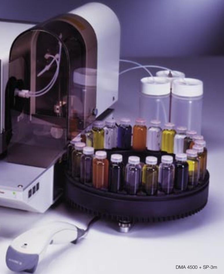
DMA 4500 + SP-3m

Bedienen Sie das DMA 4500 so leicht wie einen PC, indem Sie eine Tastatur und/oder einen Barcodeleser verwenden. Ein Drucker kann angeschlossen werden, um die aktuellen oder die gespeicherten Messergebnisse auszudrucken.