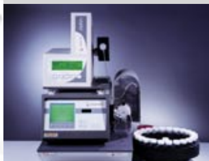
DMA 4500 + AMVn + SP-1m