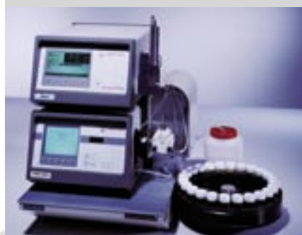
DMA 4500 + Alcoalyzer + SP-1m