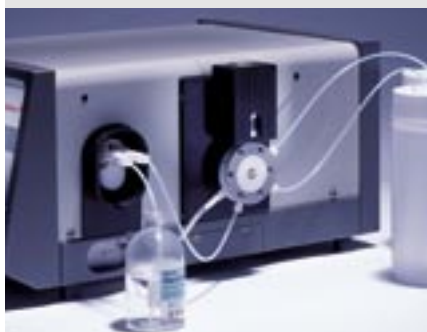
SH-3 Füll- und Spülsystem